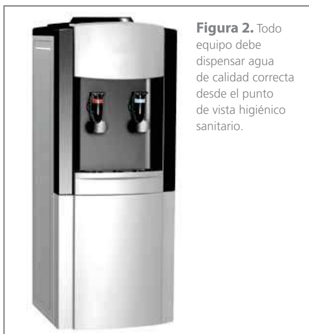
Figura 2. Todo equipo debe dispensar agua de calidad correcta desde el punto de vista higiénico sanitario.

Todo lo indicado con anterioridad sujeto a la voluntad del consumidor debe llevarse a cabo con la seguridad de que el tratamiento administrado dispense agua de calidad correcta desde el punto de vista higiénico sanitario. De aquí el gran interés de la administración en cumplir con este objetivo prioritario ( Figura 2 ).