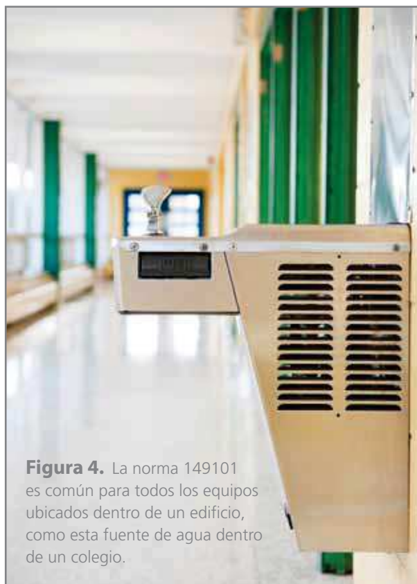
Figura 4. La norma 149101 es común para todos los equipos ubicados dentro de un edificio, como esta fuente de agua dentro de un colegio.

- Disponer de un ensayo enfocado a la calidad del agua tratada cumpliendo un requisito fundamental. Exigir al equipo de tratamiento que tras su paso a través del mismo no transmita al agua tratada sustancias o propieda-