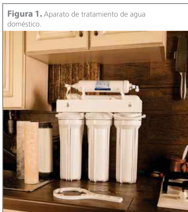
Figura 1. Aparato de tratamiento de agua doméstico.

Muchos de los aparatos ahora regulados, simplemente acercan, enfrían o calientan el agua de red, por lo que tienen un papel positivo en la hidratación.